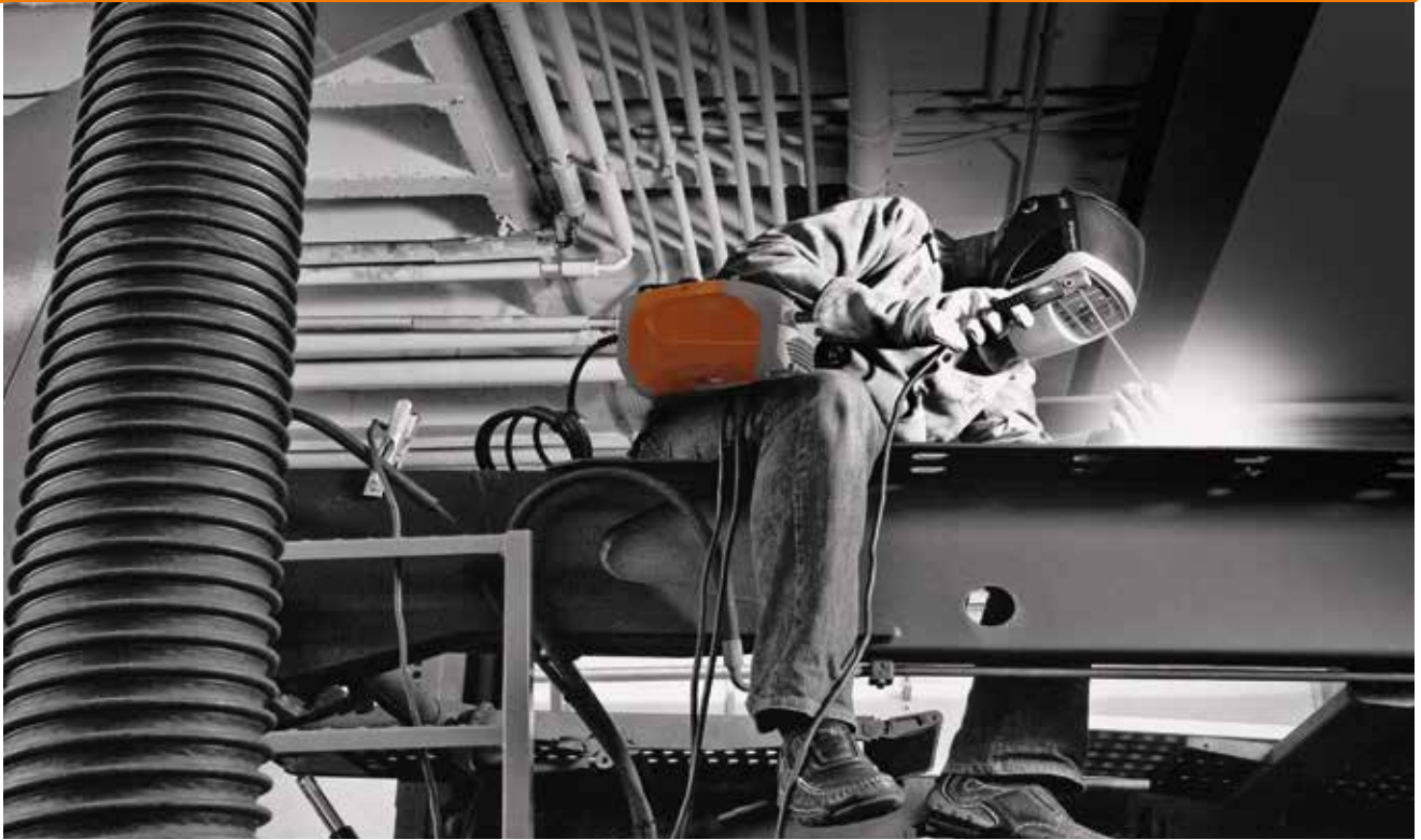
BOOSTER2 beim Einsatz im Stahlbau. Ultramobil, sichere Handhabung und volle Leistung.