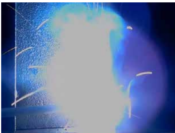
Hoher Strom = Einbrand