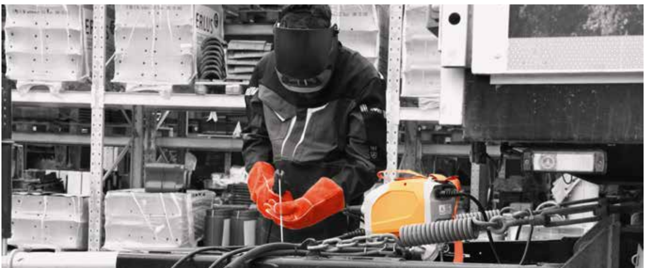
BOOSTER2 beim Reparatur-Einsatz. Immer zuverlässig Einsatzbereit.